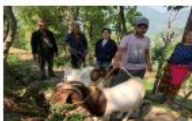
७५ प्रतिशतको नोयर नोका