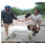
१०० प्रतिशतको नोयर नोका