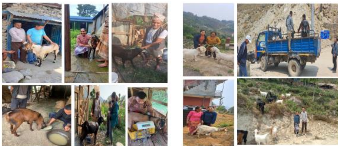
जमुनापारी क्रोस बाखा/बोका वितरण