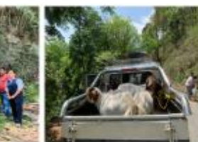
१०० प्रतिशतको नोयर नोका