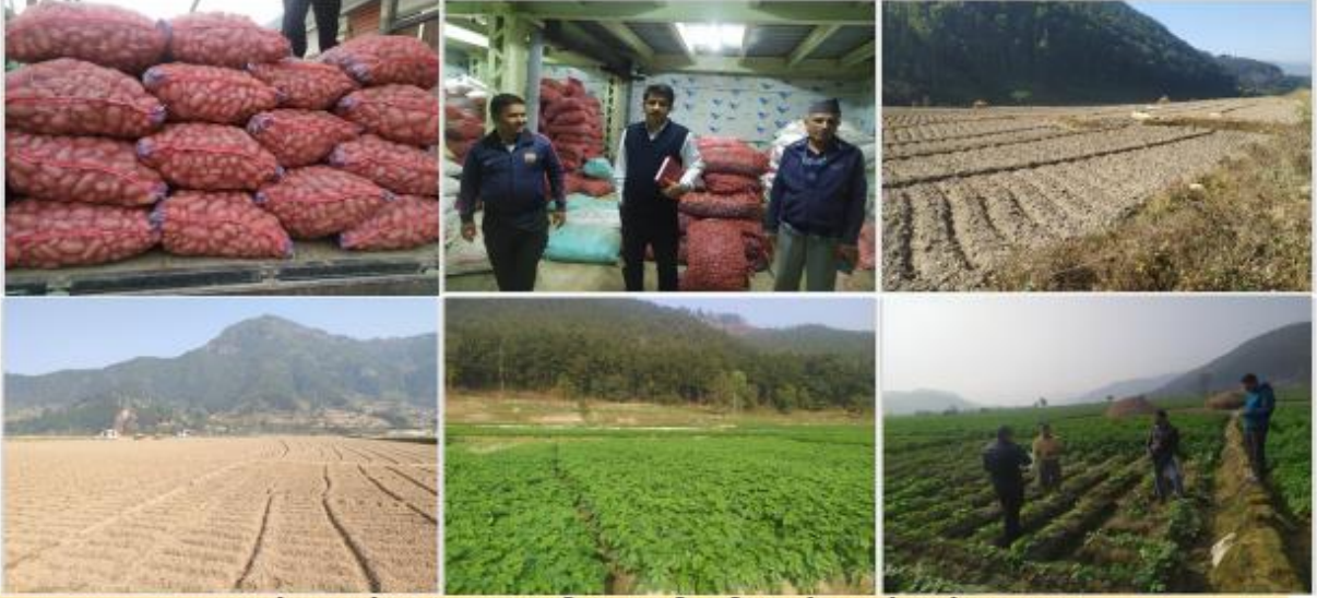
आलु जोन नुवाकोट र रसुवामा संचालित आलु विजवृद्धि सहयोग कार्यक्रमको झलकहरु